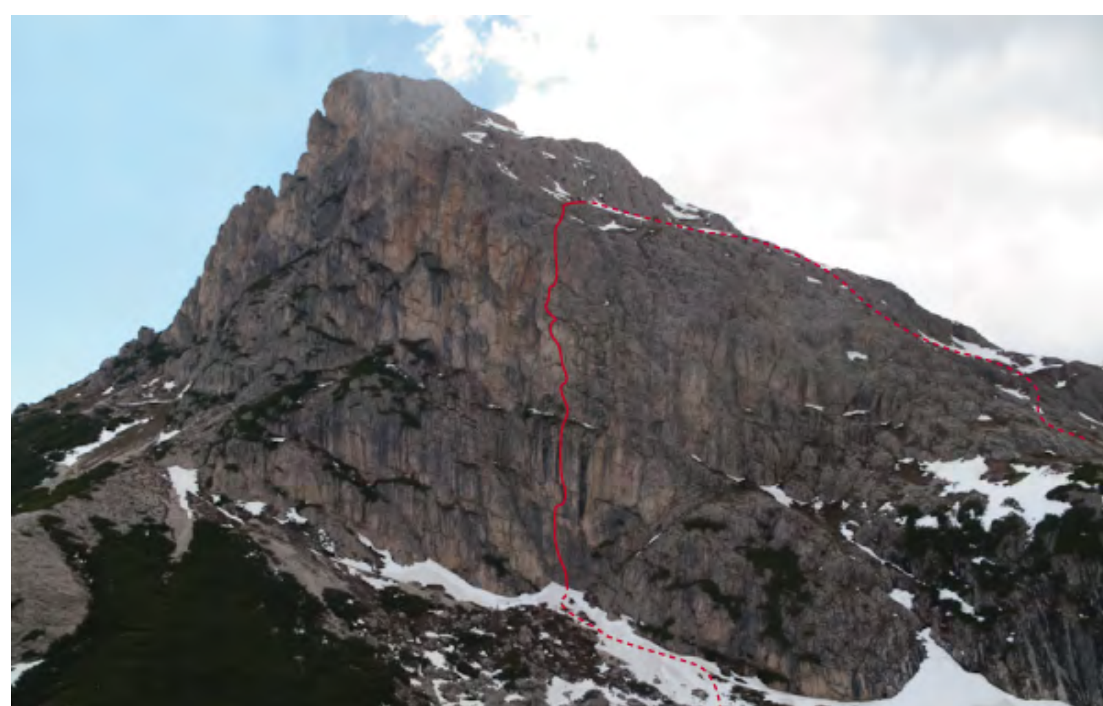
Il Sass de Stria e lo schizzo di salita.