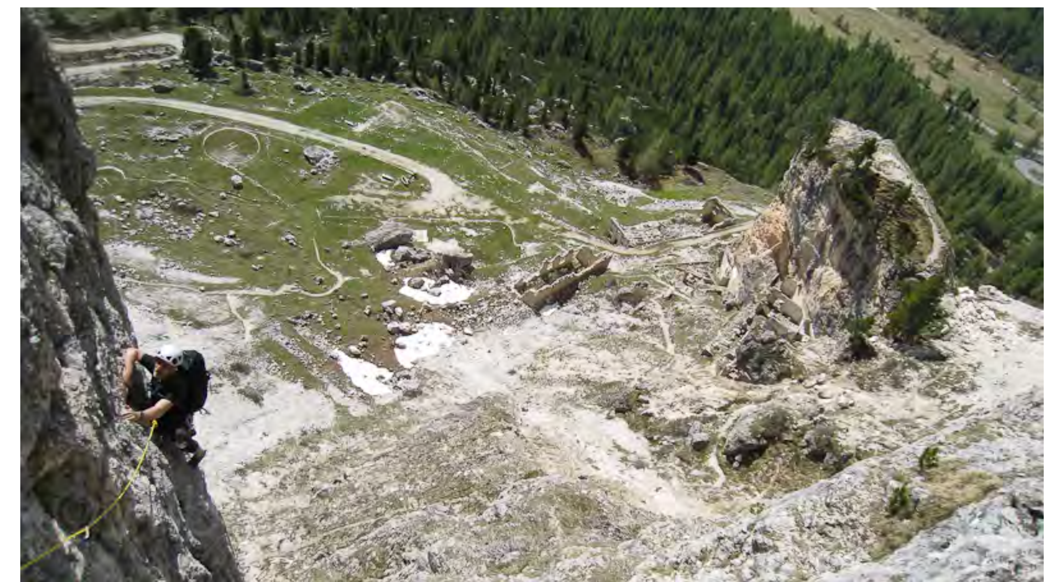
E. Baccanti in azione su L2

Discesa: dalla cima per cresta erbosa, si prosegue per canalino della via normale verso N (bolli rossi e qualche cementato per calata, oppure I/II grado) fino alla forcella tra la cima e la Torre Grande di Falzarego. Si continua per tracce di sentiero e qualche tratto di I/II grado, prati e mughli fino alla strada di guerra. Di qui per sentiero al parcheggio. 1 ora.